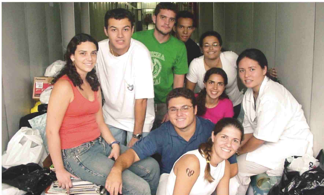
A campanha de doação de alimentos foi uma das ações do Trote Solidário