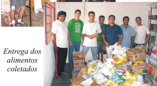
Entrega dos alimentos coletados