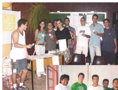
Dia da prevenção da DST

O trote ainda guardou outras surpresas para os calouros da FMJ. Uma grande coleta de alimentos, remédios e livros foi realizada na Vila Arens. Todos os mantimentos coletados foram entregues em instituições de caridade. A iniciativa recebeu o reconhecimento de uma série de personalidades do Município. Para finalizar o trote 2002, uma doação coletiva de sangue realizada em parceria com a Colsan, tomou o ambulatório de especialidades da FMJ. Acompanhados do diretor Maia, os alunos doaram sangue voluntariamente. Ao final, cerca de 100 bolsas de sangue engordaram o estoque do hemocentro.