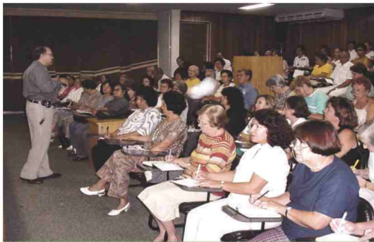
Palestras são ministradas por professores da FMJ