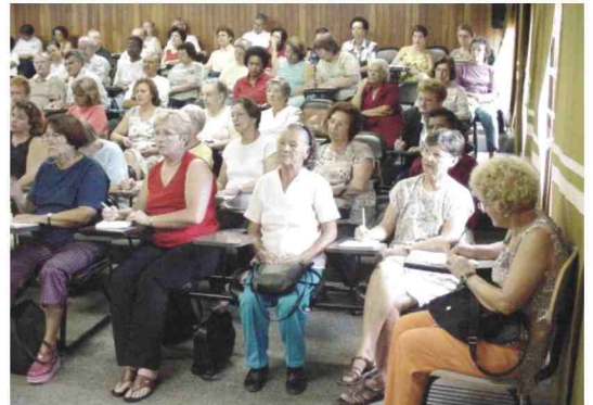
Curso da Terceira Idade: sala lotada todas as quintas-feiras

Entre os temas abordados, estão: “O Idoso e a Família”, “Cuidadores de Idosos”, “Bem Estar Psicológico”, “Mercado de Trabalho”, “Depressão”, “Atividade Física” e “Relações Familiares, Conjugais e Sexualidade”. Todos os temas são colocados em forma de palestras, por professores da Faculdade, entre as 7h30 e as 9h, na FMJ. O curso é gratuito e têm atraído cerca de 100 pessoas todas as semanas. Portanto, os interessados devem agendar a presença na FMJ. Maiores informações pelo telefone 4587-1095.