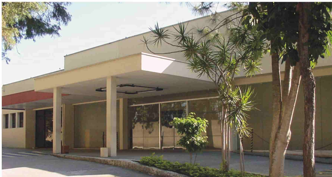
Sede do futuro Hospital Universitário