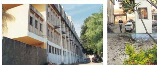
Fundo da Faculdade antes e durante as reformas