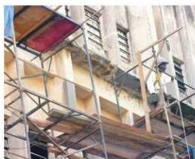
Funcionários trabalham nas reformas da parte posterior do prédio