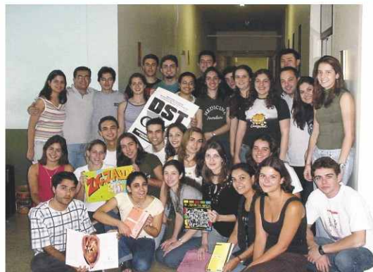
Conversas orientam alunos de 5ª e 6ª séries

escola Siqueira de Moraes, no bairro do Vianelo. Lá, passaram a ter conversas informais com os alunos de quintas e sextas séries, abordando de uma forma aberta, os temas polêmicos, que até então eram tabus para os adolescentes.