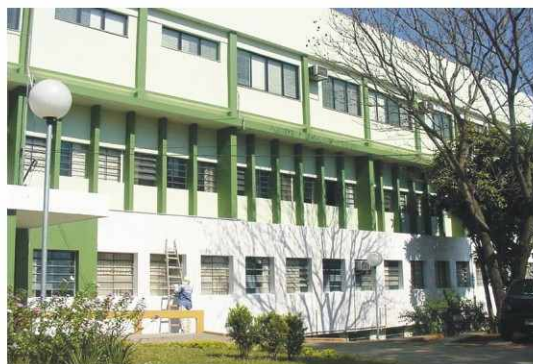
Nova pintura dá mais vida à fachada da FMJ

A reestruturação da parte de trás do prédio da FMJ e a pintura total do edifício já estão sendo executadas. O objetivo da reforma estrutural e estética é transformar a FMJ em um marco visual da cidade. Portanto escolhemos o verde cor da medicina para cobrir as paredes da FMJ. Nosso logotipo também será pintado na parte superior do prédio, para a