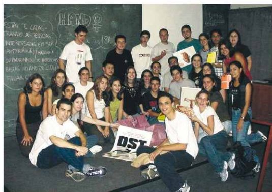
Alunos do grupo de orientação do projeto "Dito e Feito"

Os alunos dividiram-se então em sete grupos de cinco integrantes e começaram a freqüentar diariamente a