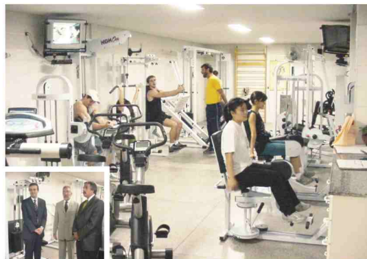
Academia em funcionamento

som ambiente, fazem da Sala Serra do Japi, uma academia moderna e agradável.