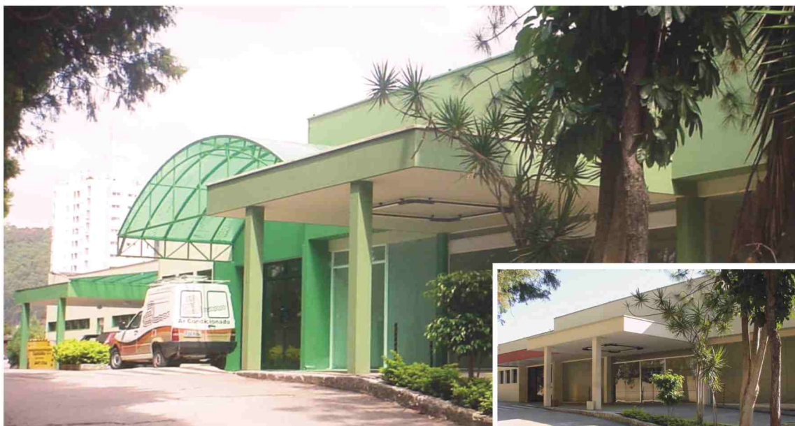
Reformas realizadas no HU