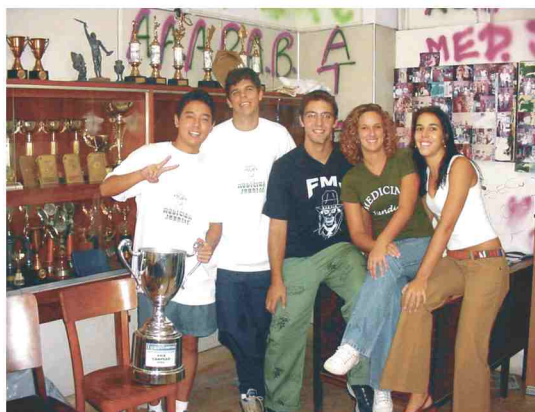
Diretoria da Atlética antes da viagem para a Pré-Intermed

Atlética viaja para Pré-Intermed e agradece a frequência nos treinamentos