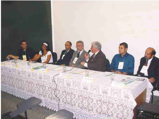
Professores das escolas da região reunidos para as discussões da oficina