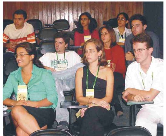
Alunos da Faculdade de Medicina de Jundiaí assistem às palestras da oficina da regional da ABEM