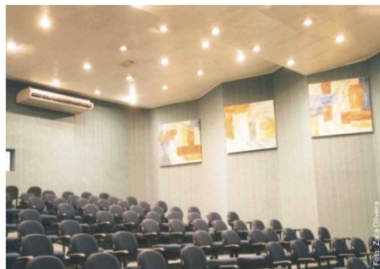
Auditório equipado com sistema de videoconferência

assistir aos procedimentos cirúrgicos em tempo real, do anfiteatro do HU. “Esse é um advento de importância ímpar na formação do médico”, afirma o diretor Maia.