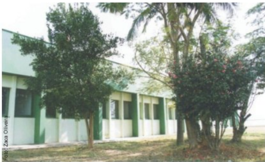
Área externa arborizada

com sete consultórios, sala de atendimento de urgência com três leitos, sete cabinas de inalação, sala de sutura, uma de observação pediátrica com mais quatro leitos, um pronto atendimento de Ginecologia e Obstetrícia com sala de urgência, de observação e quatro consultórios.