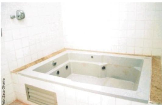
Banheira de hidromassagem

O HU ainda possui uma brinquedoteca, um lactário, banco de leite humano, central de hemoterapia, serviço