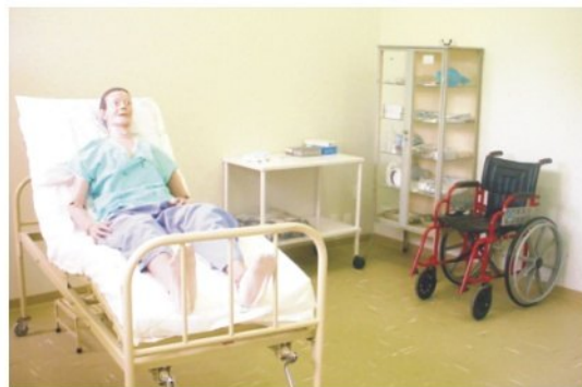
Laboratório de Enfermagem

O Laboratório de Enfermagem dará aos alunos do mais novo curso da FMJ, a estrutura necessária para o desenvolvimento do aprendizado prático. Nesse sentido, o Hospital Universitário está provido das mais modernas tecnologias de ensino. As salas de cirurgia estão preparadas para a realização de videoconferências. Os alunos poderão