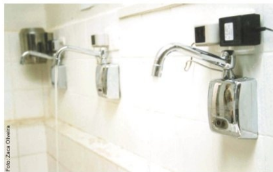
Centro cirúrgico reformado sob os padrões da Anvisa

apropriadas para que o trabalho de parto transcorra normalmente. Para completar o atendimento nas áreas de GO e Pediatria, o HU conta com UTI neonatal e semi-intensiva, equipadas com o que existe de mais moderno no setor hospitalar e respeitando todas as normas da Anvisa (Agência Nacional de Vigilância Sanitária).