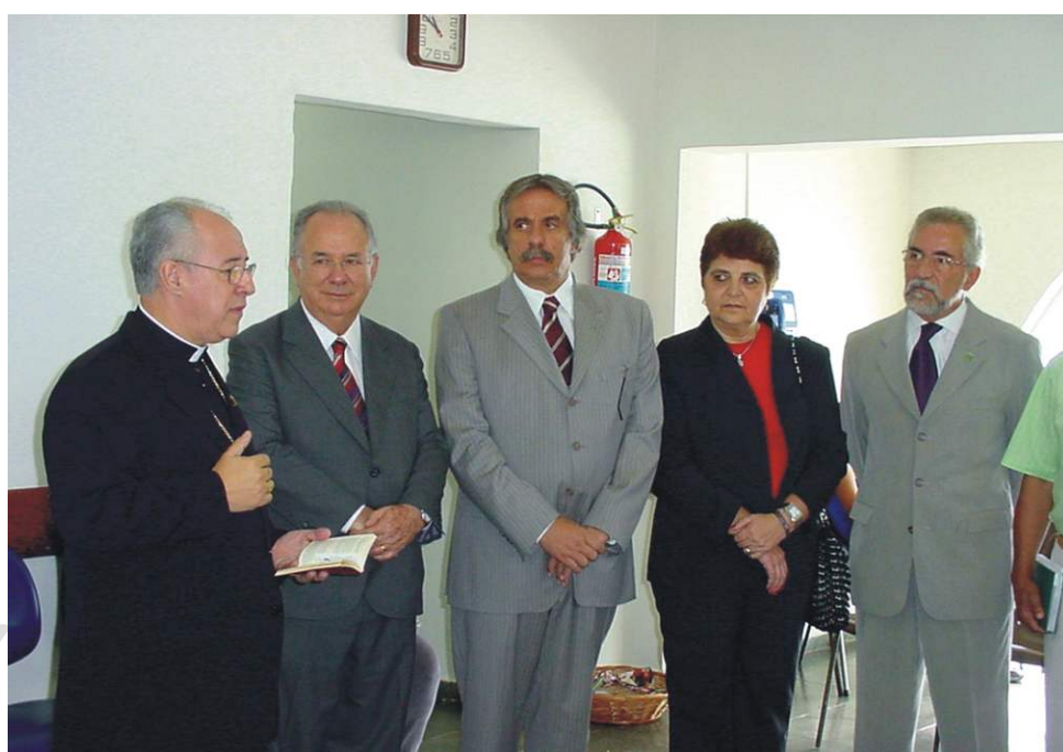
Benção da nova ala do ambulatório de especialidades.