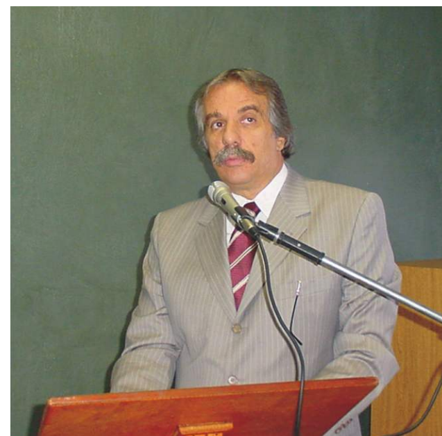
Vice Juca ministra aula inaugural da FMJ.

Em relação à FMJ, Juca planeja a implantação do ambulatório geral nas instalações onde funciona o nosso ambulatório de especialidades. Assim, nosso pequeno centro de atendimento seria ainda mais indicador de assistência básica do Município. Uma central de diagnósticos ginecológicos no Hospital Universitário e um novo investimento em equipamentos também estão nos planos do secretário. "O HU terá a UTI materna em breve e, a longo prazo, será transformado em Hospital Geral Público de baixa e média complexidade", planeja Juca. O secretário defende a ampliação do hospital da Faculdade e reforça os apoiadores do HU que constatarem os incrementos que o hospital trouxe para a Saúde Municipal. "O HU foi um sonho e se tornou uma realidade muito importante para Jundiaí. Continuaremos apoiando essa instituição e faremos com que ela cresça ainda mais", afirmou o vice-prefeito.