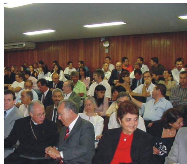
Auditório lotado para as comemorações do aniversário da Faculdade.