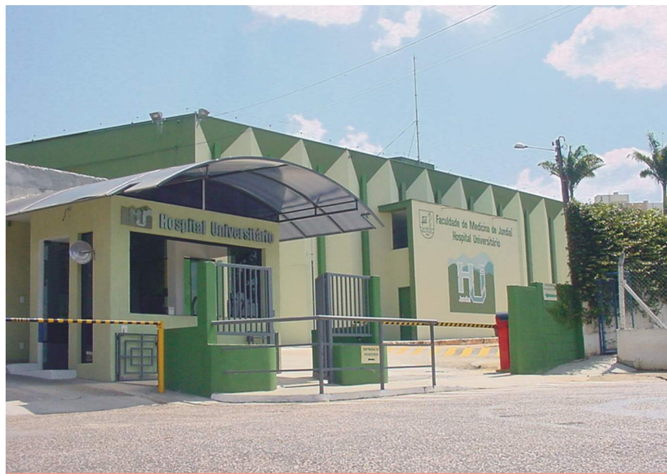
Instalações modernas e profissionais capacitados. Mesmo assim, HU continua a ser bombardeado pela mídia e políticos de oposição.