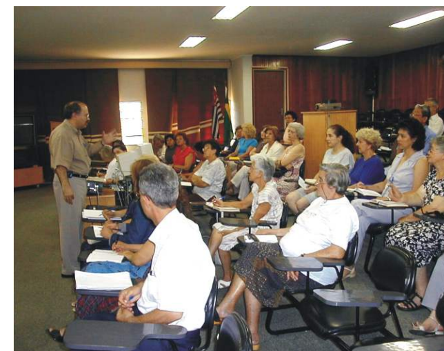
"Curso da Terceira Idade" é sucesso de público.

Este ano, os assuntos médicos, psicológicos e sociais serão divulgados não apenas pelos professores da FMJ, mas também por outros profissionais convidados. Todos serão colocados em forma de palestras. O curso é gratuito e vai até o dia 22 de dezembro discorrendo sobre os mais variados temas. A Instituição lembra que serão aceitos apenas participantes de 60 anos, ou mais, e alfabetizados.