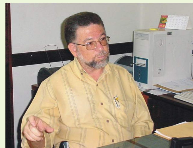
Hoje, como Secretário Executivo da FMJ.

Fomos nota "B" no Provão e formamos bons profissionais para o município. A mão de obra que a FMJ oferece a Jundiaí é de primeira qualidade. Hoje somos imbatíveis, a FMJ é uma tradição na cidade. Ninguém pensaria em fechar a faculdade como se fez no passado e isso é uma grande vitória. Ainda mais depois do advento do Hospital Universitário, a nossa participação na assistência da cidade tornou-se indispensável.