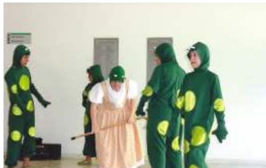
Crianças especiais se apresentam no saguão do hospital

O encerramento da semana ficou por conta de uma apresentação de balé com crianças especiais da Bem Te Vi e do PIO X.