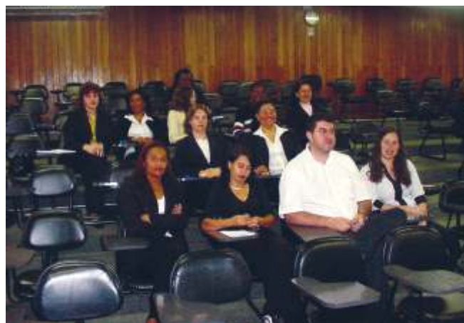
Funcionários participam do treinamento

A expectativa da faculdade foi atingida e contribuiu para uma mudança cultural buscando a excelência em serviços.