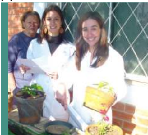
Alunos vistoriando as residências na Vila Hortolândia.

Pelo terceiro ano consecutivo, a disciplina de Parasitologia da Faculdade de Medicina de Jundiá em parceria com Zoonose visitou a Vila Hortolândia e Vila Esperança com objetivo de detectar focos do mosquito da dengue e tirar as dúvidas da população local.