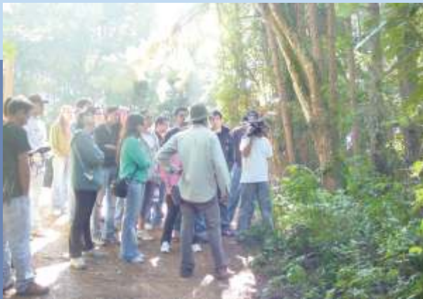
Aula durante a caminhada na Serra.

O objetivo do passeio era provar para os futuros médicos que é fundamental analisar o paciente como um todo: detectando a doença, observando o problema, analisando o ambiente em que a pessoa vive e explicando as formas de prevenção. "A visão deste futuro profissional deve ser holística", esclarece o professor.