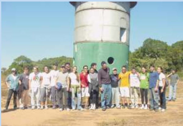
Alunos no observatório da Serra do Japi.

A aula era de saúde ambiental e os alunos puderam aprender sobre preservação do solo, da água e de todos os fatores que envolvem o ambiente. Neste trajeto de aproximadamente um quilômetro, a natureza foi o local escolhido para o contato dos alunos com algumas espécies de ervas medicinais.